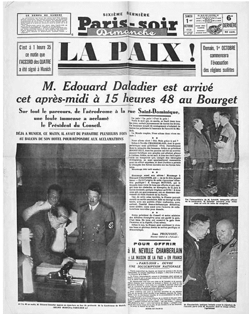
Doc.1 : Une du journal France-Soir du 30 septembre 1938.

L'analyse de documents constitue le cœur de votre travail, mais nécessite pour être menée la mobilisation de vos connaissances.