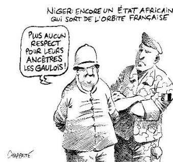
© Chappatte, « Coup d'Etat au Niger », dans le Canard enchaîné (16/08/2023)