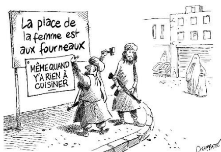
© Chappatte, « Les Talibans, un an après », dans le Canard enchaîné (18/08/2022)